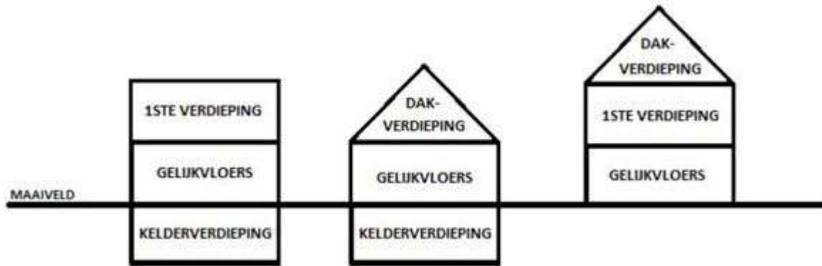
figuur 3: maximaal toegelaten gabarit