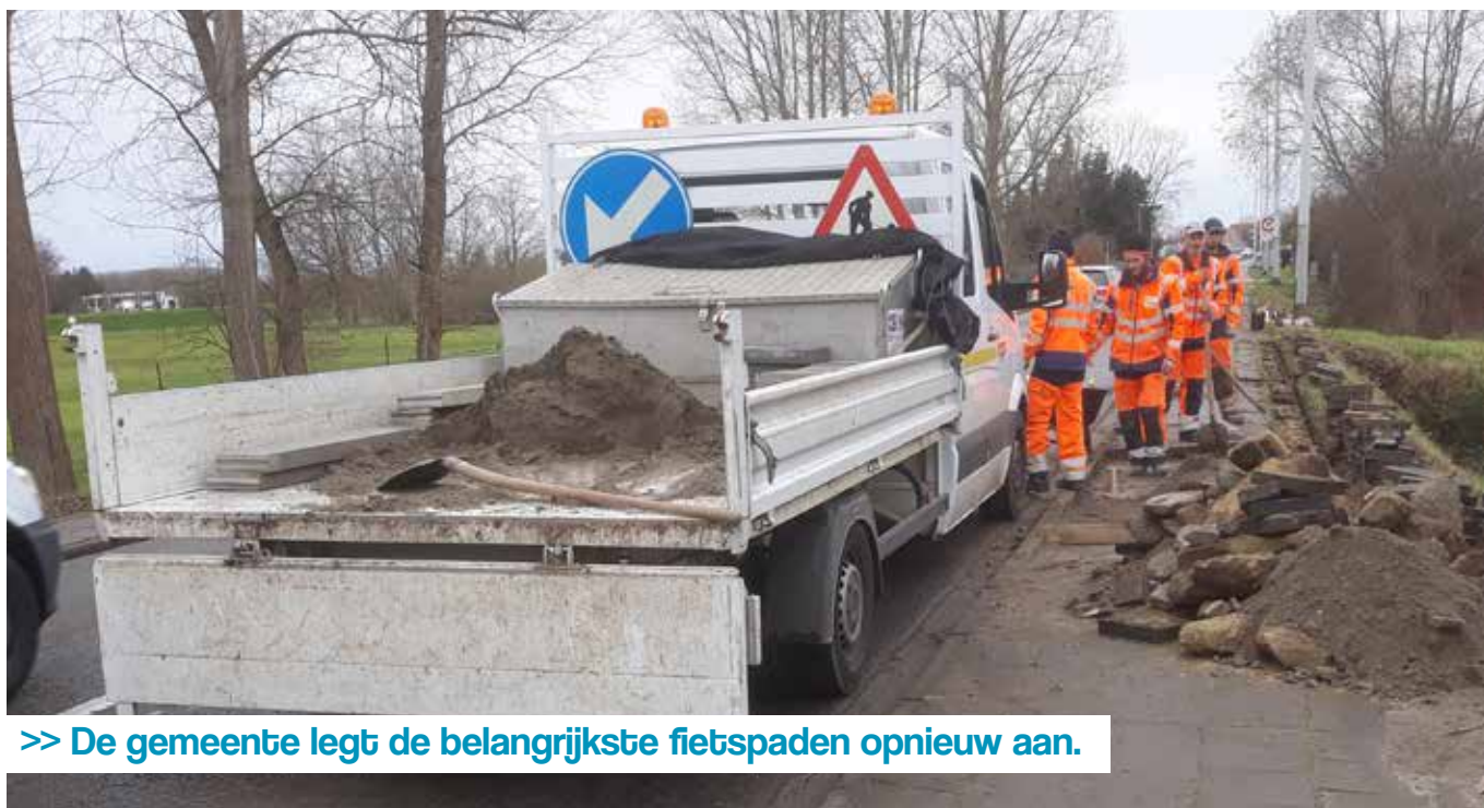
>> De gemeente legt de belangrijkste fietspaden opnieuw aan.