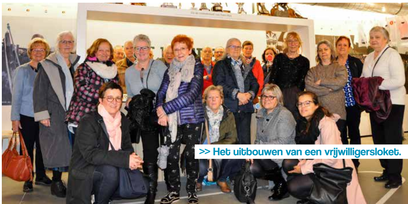
>> Het uitbouwen van een vrijwilligersloket.