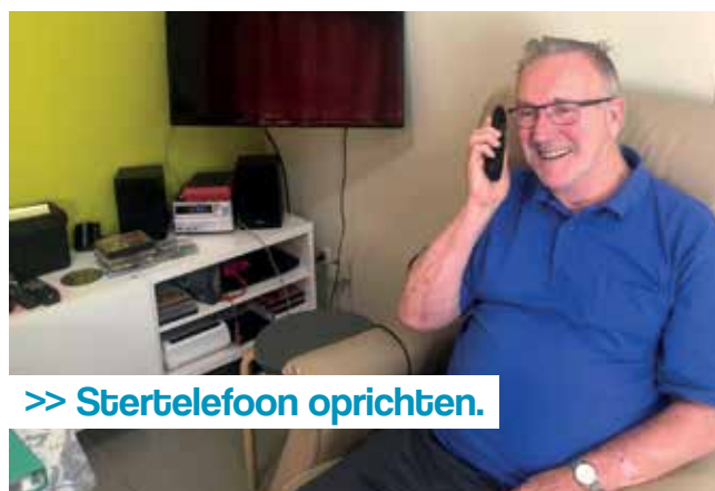
>> Stertelefoon oprichten.

Om een groter en beter bereik te hebben voor de diensten die door het Lokaal Dienstencentrum worden aangeboden, richt de gemeente tegen 2024 een buurtwerking op waarbij ze buurtcomités betreft als partners voor het sociaal beleid.