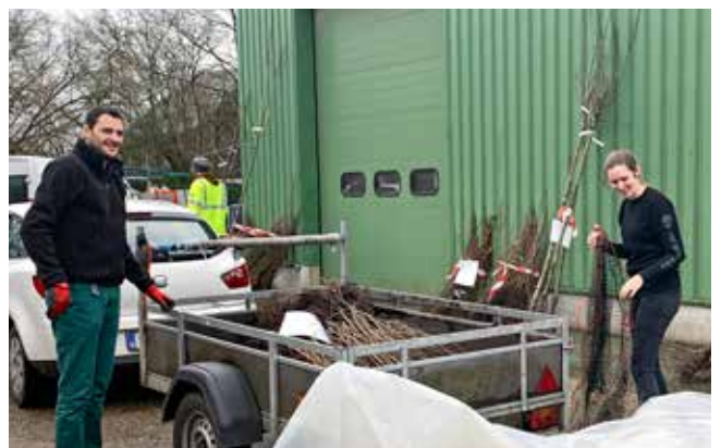
Behaag je tuin

In samenwerking met Natuurpunt stelt de gemeente een charter voor biodiversiteit op dat gebaseerd is op vier pijlers: gebiedsgerichte initiatieven, soortgerichte initiatieven, initiatieven die bijdragen aan het beleven van natuur dicht in de buurt en initiatieven die zorgen voor natuurbeleving voor iedereen. Initiatieven die nu al bestaan (behaag je tuin, koestersoorten, ...) worden hierin gekaderd.